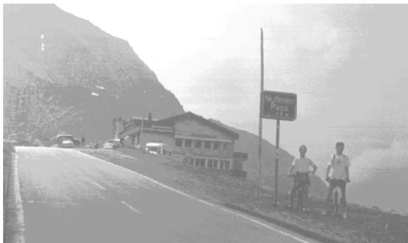
Pécsi bringások a 2440 m-es Nufenen-hágón

A következő nap egy újabb hágó megmászása volt a cél: Nufenen pass ( 2440 m ), valamint egy gleccsertó: a Gries see ( 2300 m ) megtekintése. "Ketchup" közben Mártnak beállt a bal pedál csapágya. Megjavítani nem lehetett, így a csapat egy része gyalog folytatta útját a tóhoz. Mivel ő