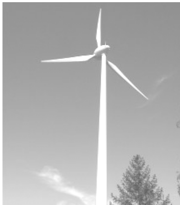
La Mancha lovagjának is tetszene

Eltérően az elektromos áram előállításának hagyományos formáitól, a szélfarmok nem termelnek semmiféle veszélyes hulladékot. Fontos szempont, hogy a szélerőmű nem csak környezetbarát technológia, de elősegíti a kistérségi önállóságát, függőségmentességét.