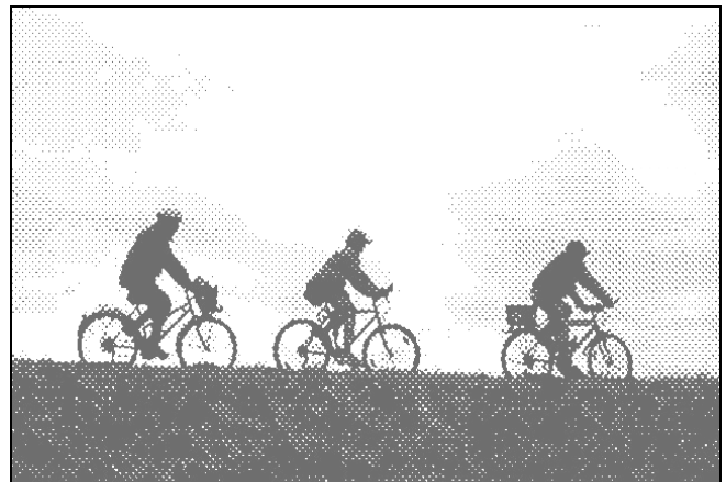
Bringatúrázók a Dráva gáton

Dráva menti kerékpárút – az Ifjúsági és Sportminisz- térium 295 ezer Ft-os támogatásával még az idén elké- szülhet a Dráva menti kerékpáros túraútvonal egy ré- szének kijelölése. A Barcs-Drávaszabolcs közötti sza- kasz kerékpáros turistaút szabványnak megfelelő ki- alakítására a Pécsi Túrakerékpáros és Környezetvédő Klub nyújtott be pályázatot. PTKK