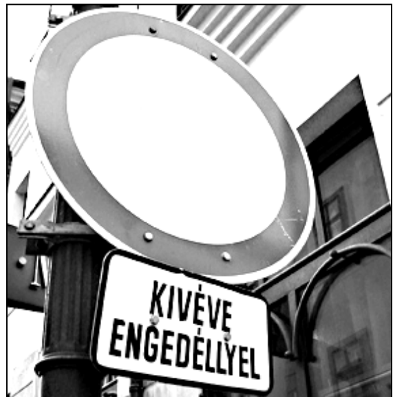
Kivéve engedéllyel - és biciklivel!

Tavasszal jómagam is részt vettem a Pécsi Túrakerékpáros Klub felmérésében, amikor kerékpáros közlekedésre alkalmas útvonalakat kerestünk. Lehetséges útvonalakat találtunk, azonban a legtöbb jelenlegi formájában nem használható. Ilyen például a Búza tér - Király utca sétálóutca előtti szakasza – Flórián utca – József utca – Széchenyi tér – Janus P. utca – Esze T. u. útvonal, mellyel kiválthatnánk a sétálóutcákat. Ehhez azonban több helyen burkolatjavításra, egyirányú utcákban ellenirányú kerékpársávok felfestésére lenne szükség.